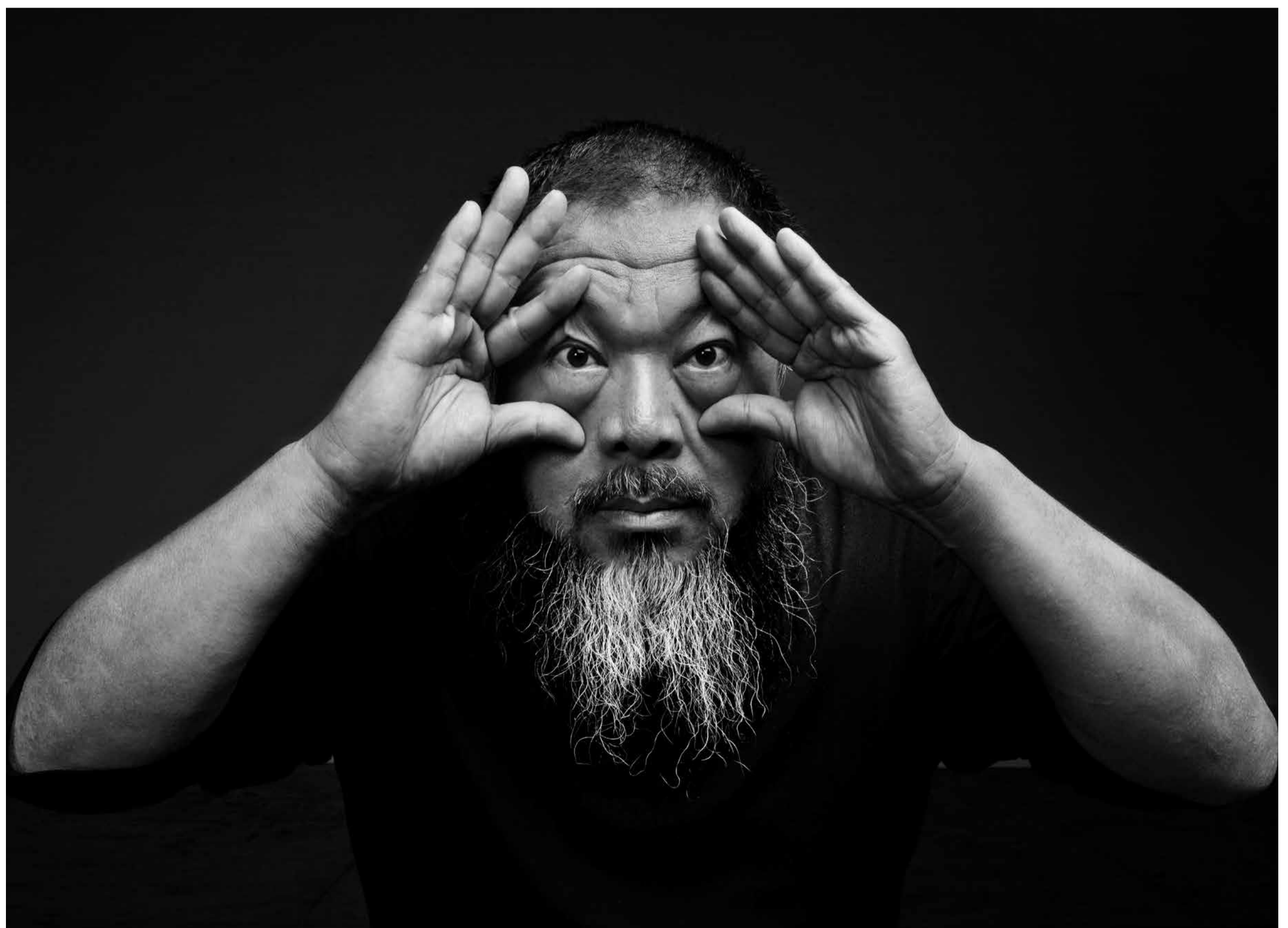
Ai Weiwei, 2012